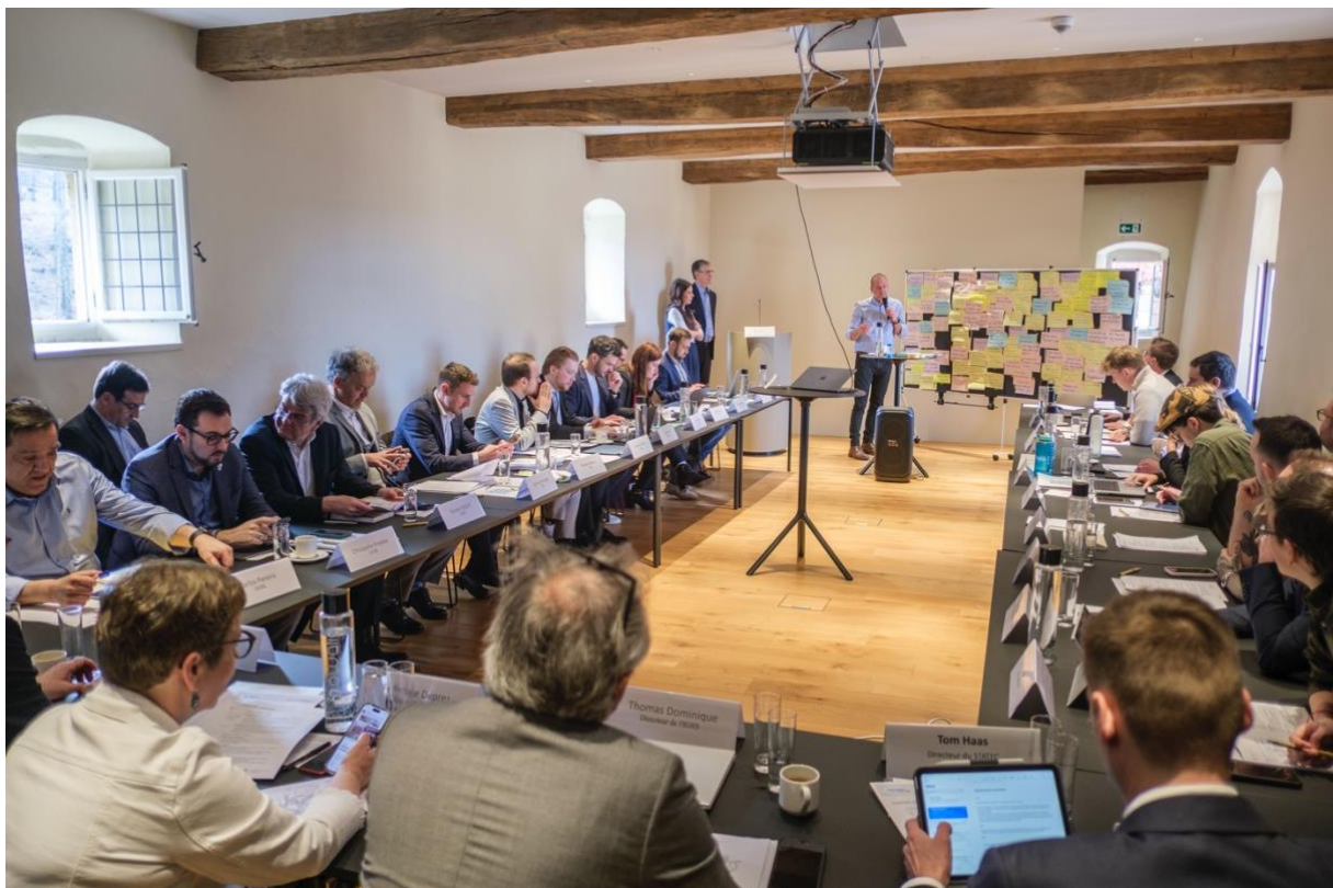
Abbildung 1: Die erste Expertenrunde fand am 21. März 2025 im Schloss Burglinster statt.