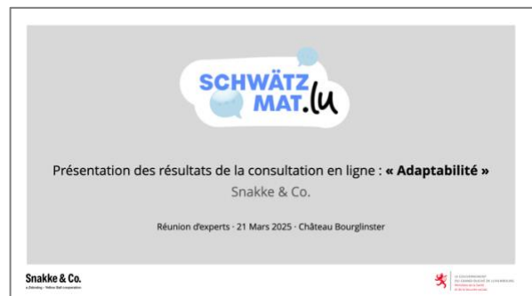
Abbildung 7: Die Präsentation von Snakke & Co. findet sich im Anhang zu dieser Dokumentation