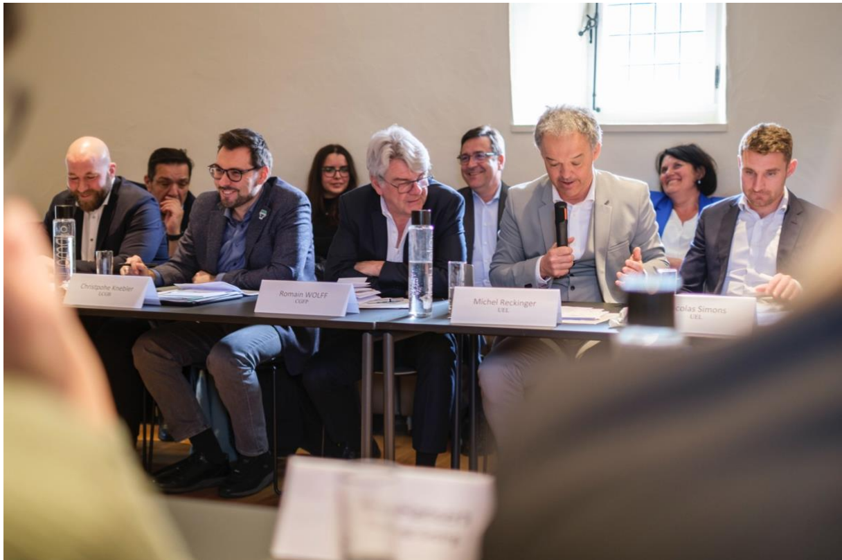
Abbildung 11: Vertreter der Gewerkschaften und des Arbeitgeberverbands während der Diskussion.

Im Anschluss kamen die Mitglieder des Gremiums dann in einer moderierten Diskussion in den gegenseitigen Austausch. Dabei nahmen sie Bezug zu den gehörten Statements oder befragten die anwesenden externen Experten.