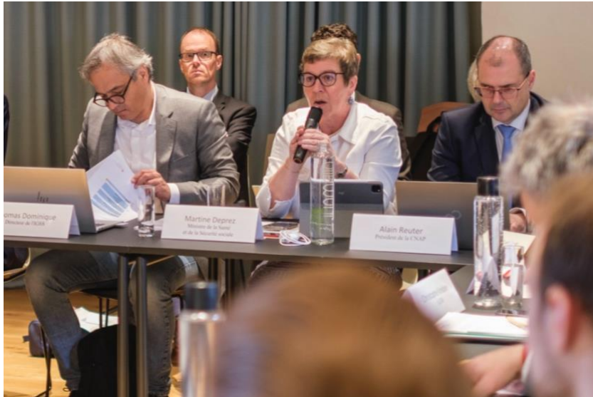
Abbildung 5: Die Ministerin für Gesundheit und soziale Sicherheit begrüßt die Mitglieder der Expertenrunde und die anwesenden Gäste zur ersten Sitzung des Gremiums.

Im Anschluss begrüßt die Ministerin die Teilnehmenden im Namen der Regierung. Sie äußert die Hoffnung, dass der Austausch in einer konstruktiven und offenen Atmosphäre stattfinden wird, mit sachlichen Diskussionen zu den Themen dieser ersten Veranstaltung.