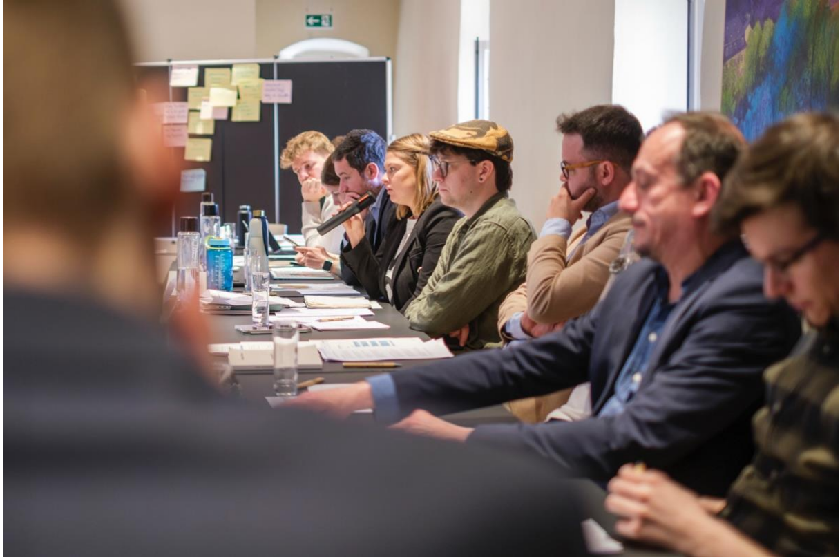
Abbildung 9: Vertreter von LSAP, ADR, déi Gréng und déi Lenk während der Runde der Statements.