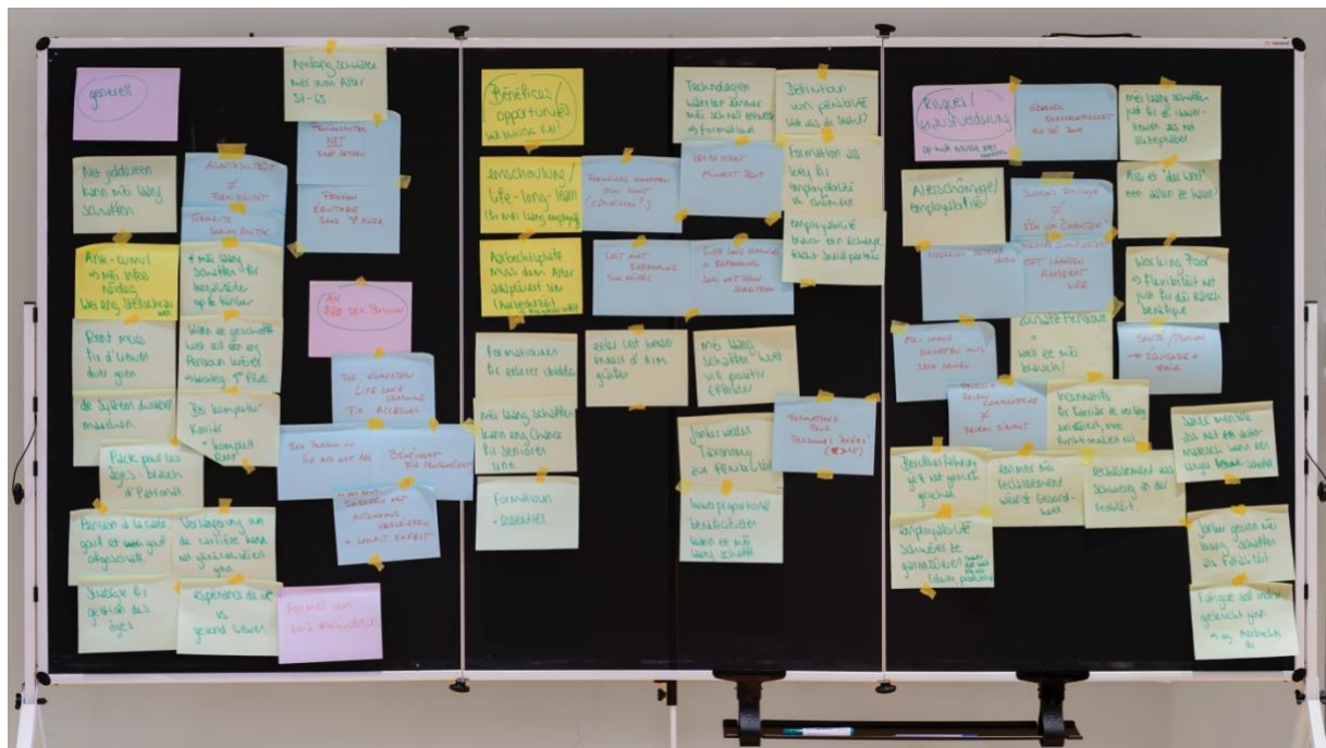
Abbildung 13: Die Beiträge der zweiten Diskussionsrunde, wie sie vom Moderationsteam festgehalten wurden. Sie sind in generelle Anmerkungen (links, inkl. dem Abschnitt „An der Pensioun“), Chancen (mitte) sowie Risiken (rechts) sortiert.