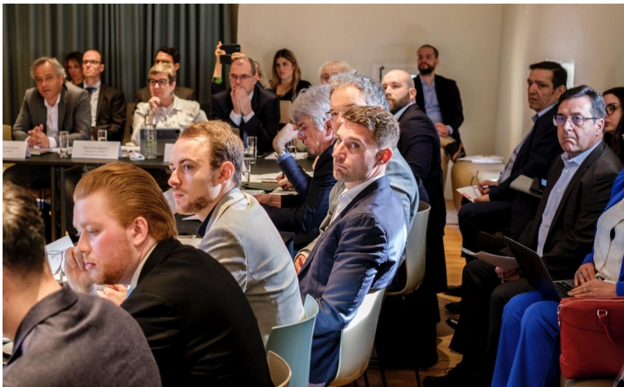
Abbildung 6: Die Mitglieder Gremiums verfolgen den Input zu Beginn der Sitzung.