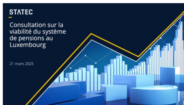
Abbildung 8: Die Präsentation des STATEC findet sich im Anhang zu dieser Dokumentation

Die Präsentation von Tom Haas, Direktor des STATEC, konzentriert sich einerseits auf die Entwicklung der Lebenserwartung. Hier wird auch für die kommenden Jahrzehnte ein weiterer Anstieg prognostiziert. Gleichzeitig zeigt sich beim Aktivitätsgrad älterer Menschen ein Trend zur Verlängerung der Erwerbsbiografien. Faktoren sind vor allem Bildungsniveau, Gesundheitszustand und Arbeitsmarktbedingungen.